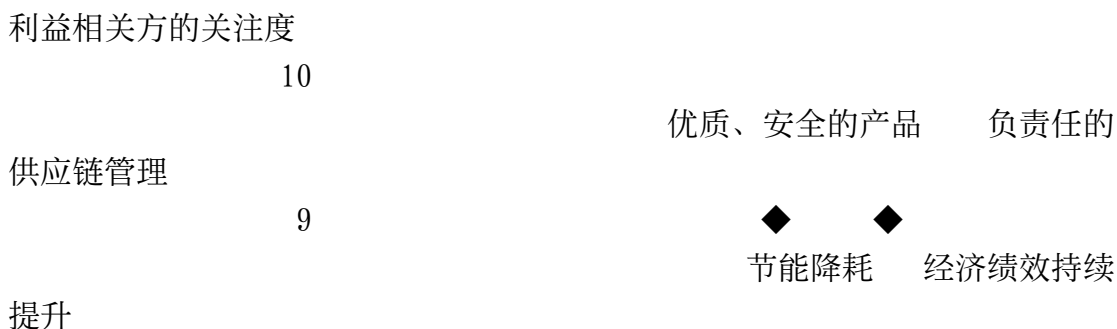
图表2 实质性议题矩阵表

公司将所有议题纳入一个议题矩阵, 分别体现利益相关方的关注度(纵向优先度)和对公司的影响(横向优先度)。